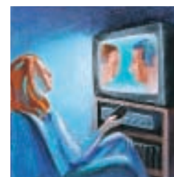
Veronica vede un film alla televisione.